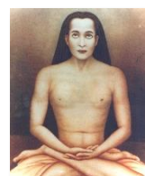
Kriya Babaji Nagaraj