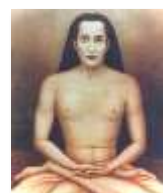
Kriya Babaji Nagaraj